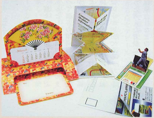
写真4: その他の紙加工品 手前が「貼合わせ葉書」の技術を応用した葉書型のフラッパー。奥の左から、ポップアップスタンド、フォールディングマップ、センターポップアップ。