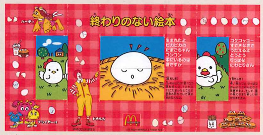
写真3: フラッパーを展開したもの これに折りと貼りの加工を施すとフラッパーになる。